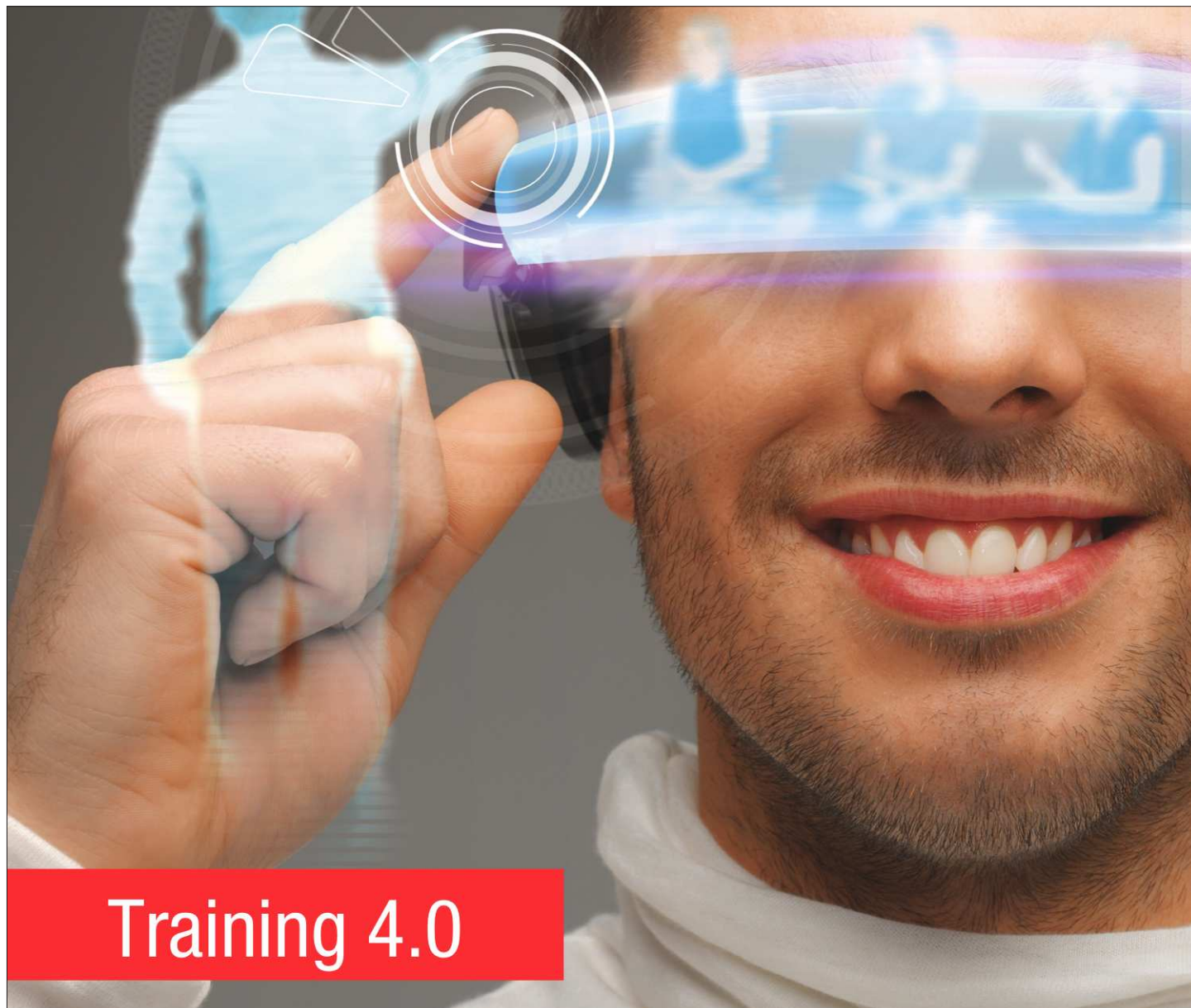
Training 4.0: Um den maximalen Lernerfolg zu erzielen, sind der Fantasie auf allen Kanälen keine Grenzen gesetzt.

Wie ein Puzzle fügen sich die Nuggets zusammen. So bezeichnen die Altdorfer die unterschiedlichen Trainingsbausteine.